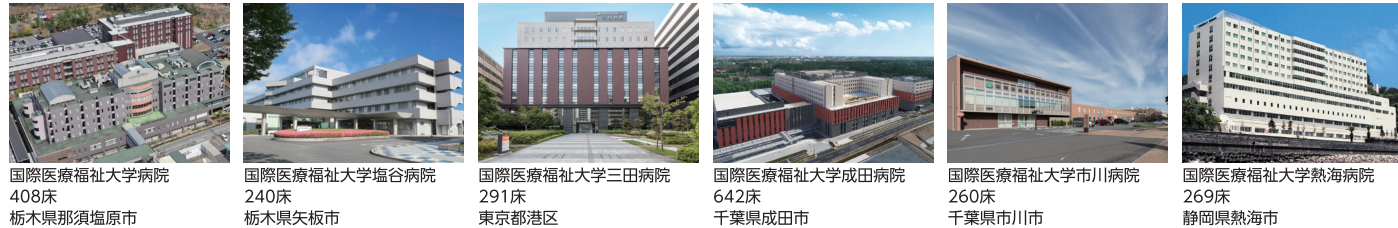
国際医療福祉大学病院 408床 栃木県那須塩原市 国際医療福祉大学塩谷病院 240床 栃木県矢板市 国際医療福祉大学三田病院 291床 東京都港区 国際医療福祉大学成田病院 642床 千葉県成田市 国際医療福祉大学市川病院 260床 千葉県市川市 国際医療福祉大学熱海病院 269床 静岡県熱海市