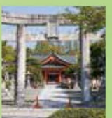
風浪宮 …徒歩14分・車5分