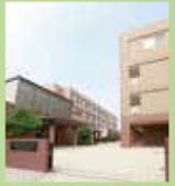
国際医療福祉大学 大川キャンパス・徒歩9分