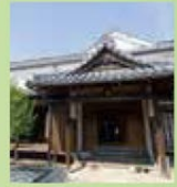
吉原家住宅 …徒歩11分・車4分