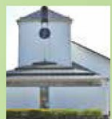
古賀政男記念館 …車7分