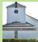
古賀政男記念館 …車7分