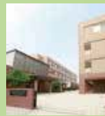
国際医療福祉大学 大川キャンパス・徒歩9分