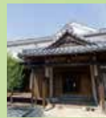
吉原家住宅 …徒歩11分・車4分