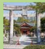
風浪宮 …徒歩14分・車5分